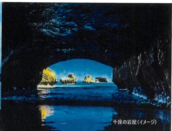
千座の岩屋(イメージ)