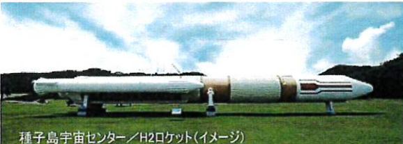
種子島宇宙センター/H2ロケット(イメージ)