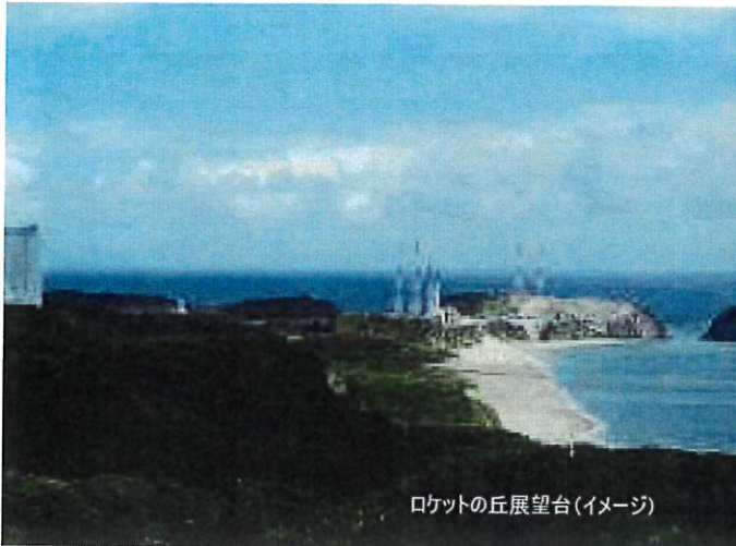
ロケットの丘展望台(イメージ)