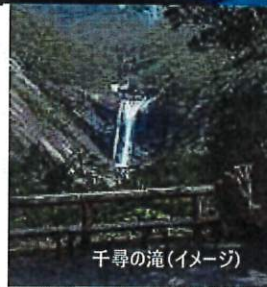
千尋の滝(イメージ)